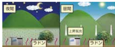
【左: 夜間、地表付近に天然放射性物質が溜まるイメージ図】 【右: 昼間、上昇気流により天然放射性物質が拡散するイメージ図】

そのほかにも、積雪により地面からの放射線が遮られ、空間線量率が低下することもあります。