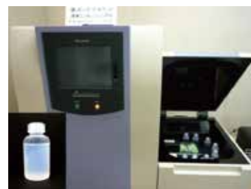
【液体シンチレーションカウンタと測定試料】